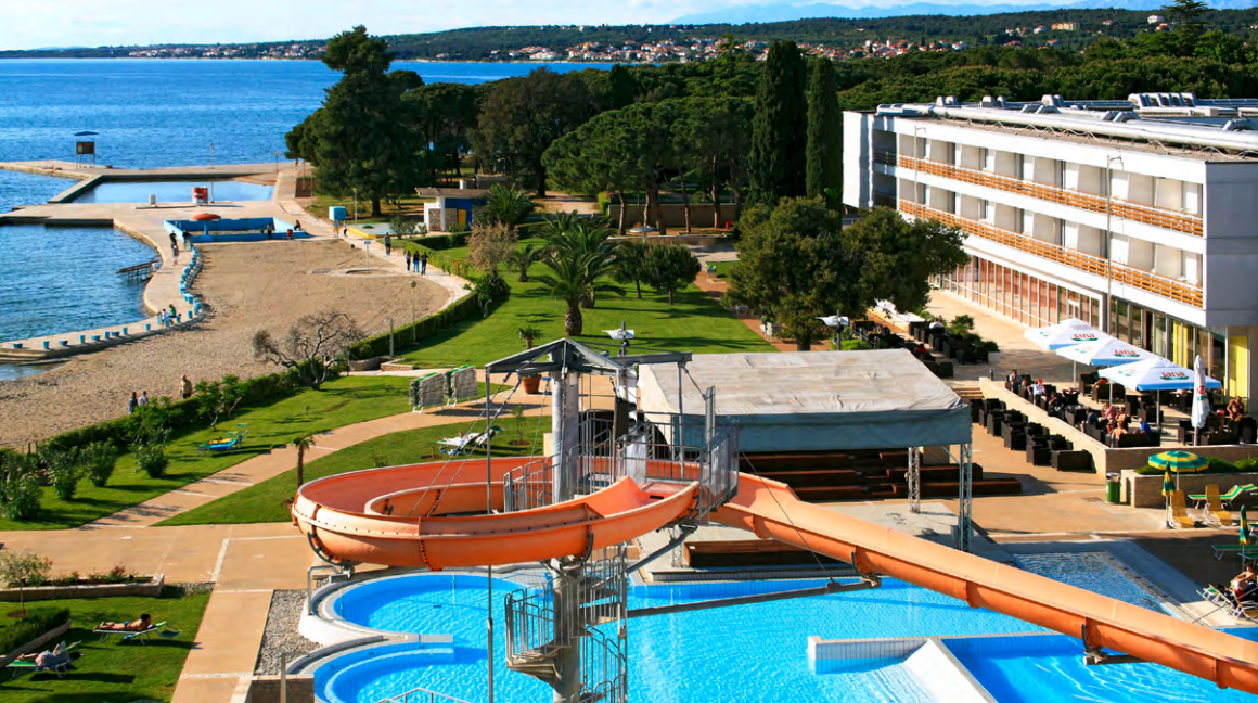
4-Sterne-Hotel Falkensteiner Club Funimation Borik

Insolvenzvers. incl./ Mindestteilnehmerzahl: 25 Pers.